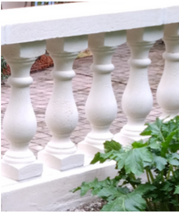
hauteur totale 87cm