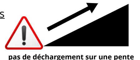
pas de déchargement sur une pente

le coût du transport est donné à titre indicatif sur le devis et il sera ajusté par le transporteur ou le vendeur suivant l'accessibilité du déchargement de la livraison.