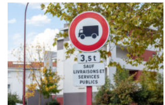
exemple restriction de tonnage au plus de 3.5t